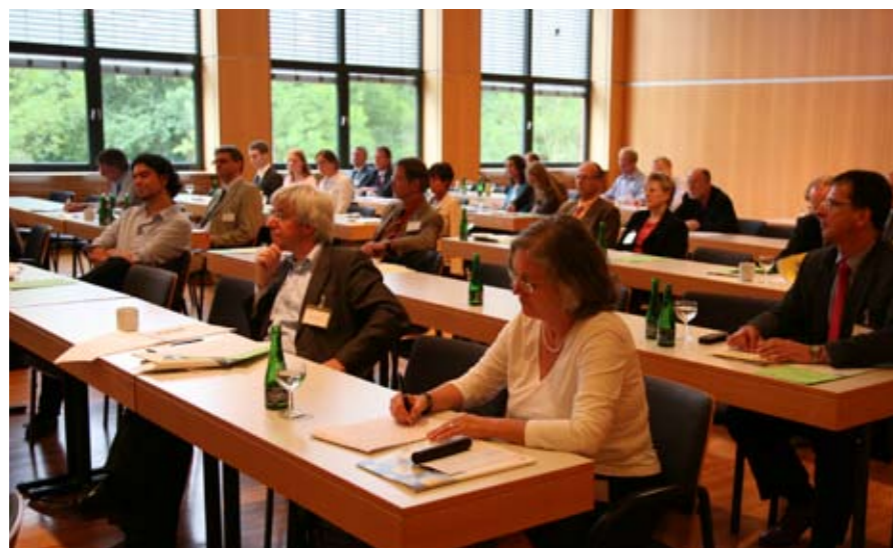
Über 40 Teilnehmer aus Wissenschaft und Verwaltung auf dem FNA-Graduiertenkolloquium.