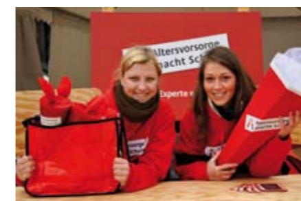
Willkommen in der Altersvorsorge-Schule der Bildungsinitiative beim Tag der Bundesministerien.

Der Veränderungsprozess der Vorsorgementalität der Bürger ist spätestens seit der Rentenreform 2001 im Gang und geht in die Richtung, die eigenverantwortliche Altersvorsorge zu stärken. Der Deutschen Rentenversicherung Bund kann dabei eine bedeutende Funktion zukommen. Dafür spricht in erster Linie die fundamentale Rolle der gesetzlichen Rentenversicherung (GRV) für die Struktur der Alterseinkünfte. Die GRV bietet einerseits die grundlegende Altersabsicherung und setzt andererseits den Anhaltspunkt für das Ausmaß der Zusatzvorsorge. Sie kennzeichnet also eine Schnittstelle der sicheren Leistungen aus Altersrenten und der erforderlichen Eigenvorsorge. Diese Doppelfunktion ist als eine neue Herausforderung zu sehen, denn sie resultiert zweifellos aus den sich verändernden Rahmenbedingungen der Alterssicherung und dadurch erzwungenen Reformen. Darüber hinaus ist die Neutralität der Deutschen Rentenversicherung Bund von Relevanz. Daraus ergibt sich die Chance einer erfolgreichen Kommunikation und Überzeugungskraft dieser Institution. Diese unabhängige Position und Objektivität fehlt den privatwirtschaftlichen Finanzanbietern zur Altersvorsorge.