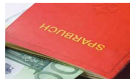
Es bleibt zu klären, ob Erbschaften tatsächlich der Ersparnisbildung oder dem Vermögensaufbau dienen.

Allerdings hängt eine differenzierte Beantwortung dieser Frage insbesondere von zwei Faktoren ab. Erstens ist zu prüfen, ob die Erbschaften derart sozial ungleich verteilt sind, dass bestehende soziale Ungleichheiten durch sie vergrößert werden. Diese Auffassung vertritt zum Beispiel Szydlik (1999). Er argumentiert, dass die Wahrscheinlichkeit einer Erbschaft mit höherer Bildung der Erben steigt, die wiederum stark mit der beruflichen Stellung der Eltern korreliert: Akademiker haben im Vergleich zu Hauptschulabgängern „eine doppelt so große Chance, bereits etwas geerbt zu haben und eine über drei Mal so hohe Wahrscheinlichkeit, zukünftig etwas zu erhalten“. Szydlik schließt daraus, dass Erbschaften die soziale Mobilität hemmen und zur Verschärfung sozialer Ungleichheiten beitragen, weil diejenigen die schlechtesten Erbchancen haben, die auch anderweitig benachteiligt sind. Im Extremfall könnten nennenswerte Erbschaften primär bei Hocheinkommensbezieher*innen anfallen, bei denen die Alterssicherung qua Rentenversicherung ohnehin eine untergeordnete Rolle spielt. Je stärker die soziale Differenzierung von Erbschaftswahrscheinlichkeit und Erbhöhe in diese Richtung ausgeprägt ist, desto geringer wäre der potenzielle Kompensationseffekt hinsichtlich der anstehenden Veränderungen der Renteneinkommen. Eine frühere Studie über Erbschaften und Vermögensverteilung von Kohli aus dem Jahre 2005 legt ein anderes Ergebnis nahe.