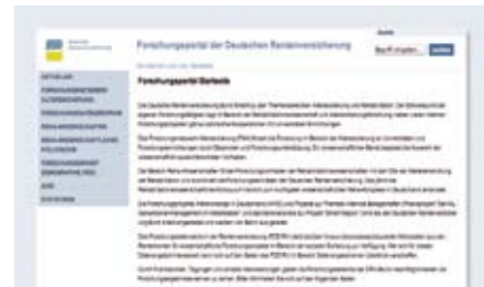
Auf der Internetseite des Forschungsportals der Deutschen Rentenversicherung unter www.driv-forschung.de sind alle Projekte aufgeführt.

Ein zentraler Bestandteil der Arbeit des FNA ist die Förderung von Forschungsprojekten im Bereich der Alterssicherung. FNA-Forschungsschwerpunkte sind