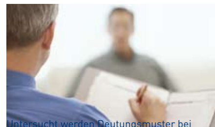
Untersucht werden Deutungsmuster bei der Einstellung Älterer in Unternehmen.