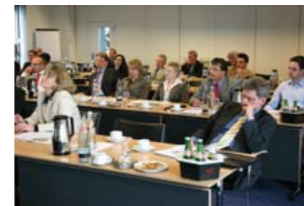
Teilnehmer des Workshops zum Thema Absicherung des Erwerbsminderungsrisikos in der gesetzlichen Rentenversicherung.

Die einzelnen Vorträge des 7. FNA-Graduiertenkolloquiums stehen im Internet unter der Adresse http://forschung.deutsche-rentenversicherung.de als Download zur Verfügung.