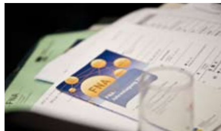
Drängende Fragen der Alterssicherung werden beleuchtet und Lösungsansätze aus dem nationalen und internationalen Blickwinkel diskutiert.

Auch im Jahr 2008 gab es eine Reihe wissenschaftlicher Tagungen und Workshops, die vom Forschungsnetzwerk Alterssicherung organisiert wurden und allen an Fragen der Alterssicherung Interessierten ein Forum zum Informations- und Erfahrungsaustausch boten.