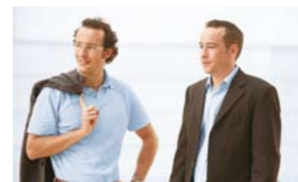
Selbstständige in der Bundesrepublik Deutschland unterliegen unterschiedlichen Alterssicherungspflichten.

Dieses Projekt hat zum Ziel, die quantitativen Effekte einer Eingliederung der Selbstständigen ohne obligatorische Alterssicherung in die gesetzliche Rentenversicherung im Hinblick auf Beitragssatzentwicklung, Wirtschaftswachstum und Beschäftigung zu ermitteln.