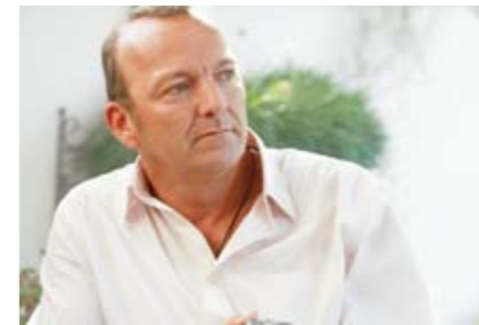
Beobachtet werden Veränderungen des Verhaltens von Beschäftigten und Optionen in den Betrieben während der Übergangsphase von Erwerbstätigkeit in den Ruhestand.

Forschungslücke verhaltenswissenschaftlicher Fragestellungen in Bezug auf die Altersvorsorge