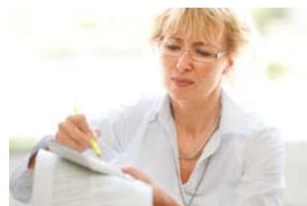
Renteninformationen weisen hohes Wirkungspotenzial auf.

In der Gesamtbetrachtung stellen sich die im Folgenden diskutierten Handlungsbereiche als besonders relevant für die Deutsche Rentenversicherung Bund heraus. Diese Überlegungen sind als Leitgedanken zu verstehen. Sie können als Grundlage für die Ableitung von konkreten Handlungszielen dienen.