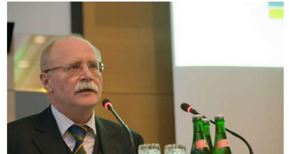
Eröffnung der FNA-Jahrestagung durch den Präsidenten der Deutschen Rentenversicherung Bund, Dr. Herbert Rische.

Die Rolle des Staates verändert sich. Untersucht wurde neben der Art und Weise, wie wir in Deutschland damit umgehen, auch die Handhabung der Herausforderungen bei unseren europäischen Nachbarn. Der Fokus der Jahrestagung lag dabei auf soziologisch-politologischen Aspekten, um aus dieser Sichtweise einen Blick auf das Zusammenspiel der verschiedenen Alterssicherungssysteme zu werfen. Interdisziplinär ergänzt wurde dies durch Vorträge aus ökonomischer und juristischer Sicht.