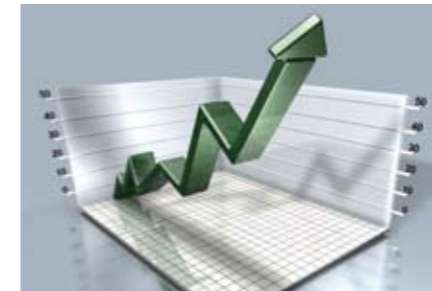
Bei der Ermittlung von Ersatzquoten laufen die Indikatoren in drei Dimensionen voneinander ab.

Ziel des Forschungsprojektes war es einerseits, die in der Literatur verwendeten Definitionen von Ersatzquoten zu systematisieren. Andererseits sollten auf der Basis individueller Längsschnittinformationen die Konsequenzen aufgezeigt werden, die sich aus der Variation des Berechnungszeitraums für den Indikator sowie aus der Bildung sozialer Gruppen ergeben.