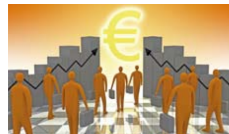
Analysiert wird der Einfluss diskontinuierlicher Erwerbsbiografien auf die Entwicklung und Verteilung der Alterseinkommen.

Die Zusammenhänge zwischen individuellen Erwerbsbiografien und zukünftigen Alterseinkommen wurden für Deutschland bereits in einer Reihe empirischer Studien untersucht. Dabei wurde zwar eine abnehmende Bedeutung des „Normalarbeitsverhältnisses“ bei gleichzeitiger Zunahme der Arbeitslosigkeit und Teilzeitarbeit festgestellt. Zum anderen war dies aber insbesondere bei den Frauen in Westdeutschland mit einer deutlichen Zunahme der Erwerbstätigkeit insgesamt und auch der Vollzeitbeschäftigung verbunden. Außerdem wurden jüngere Alterskohorten auch durch die für sie